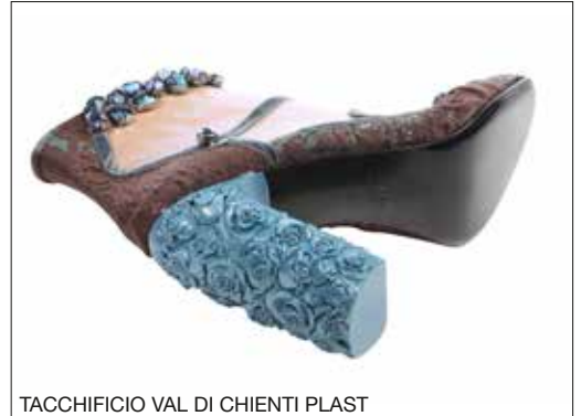
TACCHIFICIO VAL DI CHIANTI PLAST