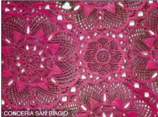
CONCERIA SAN BIAGIO